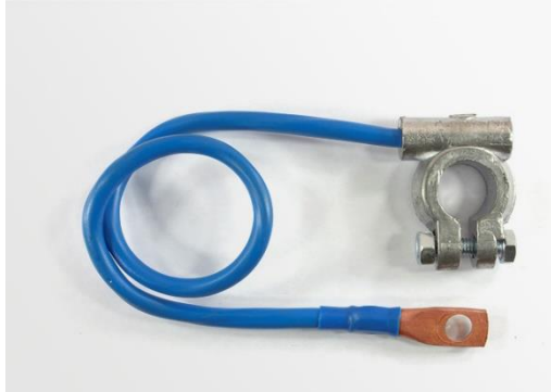
КЛЕММА «МИНУС» 25/45/65 EURO Type 1