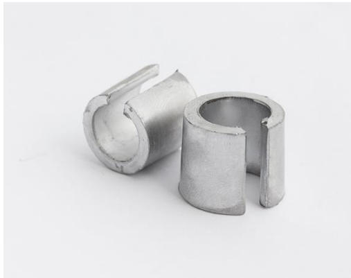
КОНУС-ПЕРЕХОДНИК ASIA Type 3 → EURO Type 1