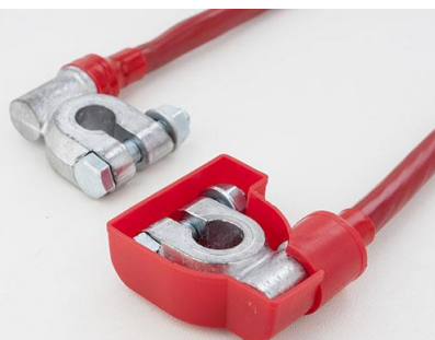
ПЕРЕМЫЧКА 45 EURO Type 1