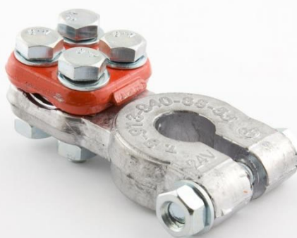
КЛЕММА ГРУЗОВАЯ БОЛЬШАЯ EURO Type 1 Крепление провода под прижимную планку.