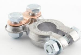
КЛЕММА ЯПОНСКАЯ ASIA Type 3 Крепление провода под прижимную планку.