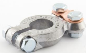
КЛЕММА ЕВРОПЕЙСКАЯ EURO Type 1 Крепление провода под прижимную планку.