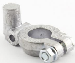
АДАПТЕР 1 EURO Type 1 → ASIA Type 3