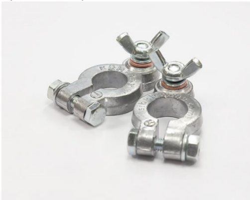
КЛЕММА С «БАРАШКОМ» EURO Type 1