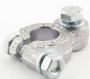
КЛЕММА ЯПОНСКАЯ (лёгкая) ASIA Type 3 Крепление провода под болт.