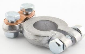
КЛЕММА ЕВРОПЕЙСКАЯ (лёгкая) EURO Type 1 Крепление провода под прижимную планку.