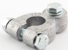
КЛЕММА ГРУЗОВАЯ МАЛАЯ EURO Type 1 Крепление провода под болт.