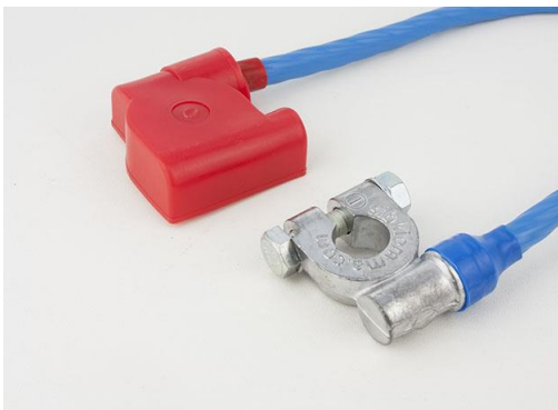
ПЕРЕМЫЧКА ГРУЗОВАЯ 45 EURO Type 1