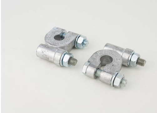
КЛЕММА С БОКОВЫМ КРЕПЛЕНИЕМ EURO Type 1 Крепление провода под болт.