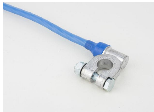
КЛЕММА «МИНУС» 25/40/65 EURO Type 1