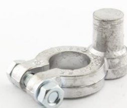
Адаптер 2 EURO Type 1 → ASIA Type 3