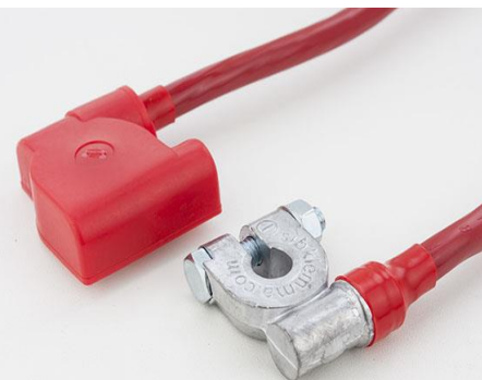
ПЕРЕМЫЧКА 25 EURO Type 1