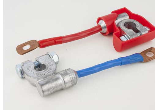
КЛЕММА ЕВРОПЕЙСКАЯ EURO Type 1